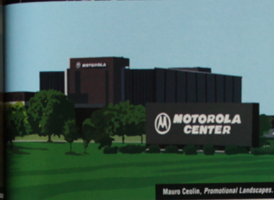
Mauro Ceolin, Promotional Landscapes