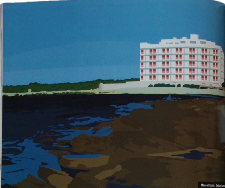
Mauro Ceolin, Obigo Landscapes