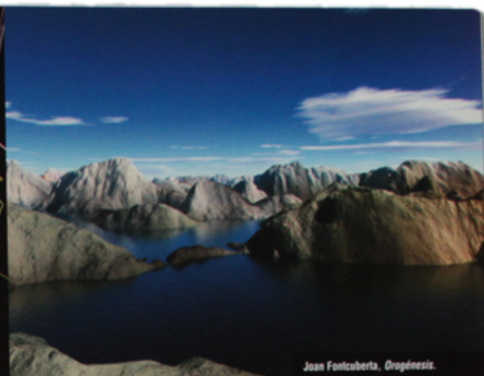
Joan Fontcuberta, Orgánesis